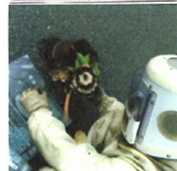
中身を見てビックリ。