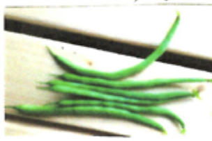
スジを取るのが楽しい。

赤くなり始めるとカラスにつつかれてしまふので、今回はバッチリ ネットも張った。近所でウロウロしていたカラスもさすがに諦めたらしく、どれもドツツリ重く育つている。わずかな苗で、こんなに豊かな気持にならなう。感謝。