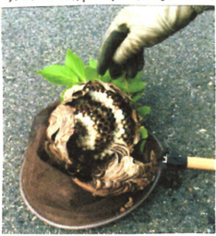
噴霧は激で、一瞬で蜂は全滅した。