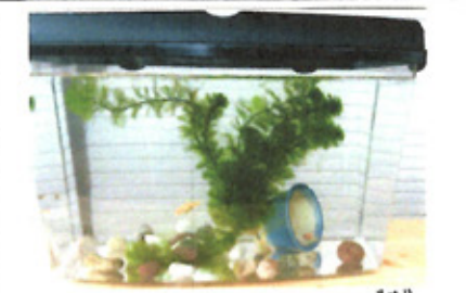
7月、きれいな水槽に移された。5mm~1cm

草木が茂ればゴミの入ホ小さな袋や空き缶を押し込むように捨てていく。当方は、毎日手入れをし、掃除を欠かさないで、いけない行ないに、ため息だ。