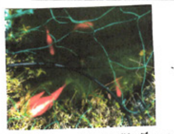
ホス金魚か、マス池の淵に遊ぼう。