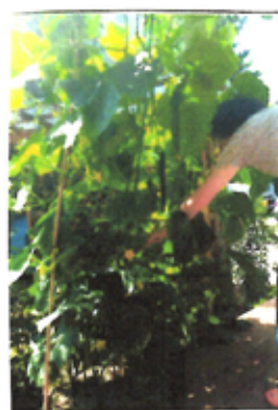
カドツツキから 木を収穫できる。毎朝が楽しい。ぬか漬けに、カラダに大活躍。

3年立った庭の木々が遅く育ち、オリーブや月桂樹に実が生った。梅も今年はこの粒ほどの収穫だ。少しづつ梅酒漬りの瓶が増えている。キョウリ、トマト、インゲン豆も数本ばかりの苗を植えたが、どれも豊作で毎日食卓にはややかた。コンポストも移動し空いた場所にモウリだけと植えてみた。土の状態が良かったのか、勢いが去年と全く違う。味も良い。