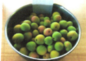
丁寧に洗って、へたを取って。

赤くなり始めるとカラスにつつかれてしまふので、今回はバッチリ ネットも張った。近所でウロウロしていたカラスもさすがに諦めたらしく、どれもドツツリ重く育つている。わずかな苗で、こんなに豊かな気持にならなう。感謝。