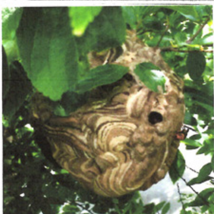
写真を撮ろうと葉をかき分けたら、突然黄と黒のは模様蜂が姿をあらわした。