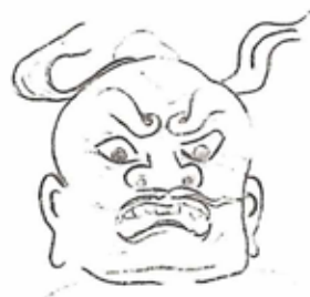
東大寺南大門金剛力士(阿形)

いつもはつきり歯を見せているのは、 明王部や、天部の一部の仏様がほとんど です。チベットの仏像を見ると大きく口 を開け上下顎に長く鋭い牙を生やして いるものがありますが、日本まで来ると さすがに表現も落ち着いてきます。