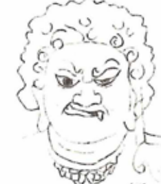
鎌倉・明王院・不動明王