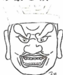
東京深川・法乗院の閻魔大王

おもしろいのは 不動明王(ふどう みょうおう)です。 天眼(左目を半 眼にする)、牙上下 出(牙を右は上、左 は下に出す)が一 般ですが中には両 目を大きく開くも の、両牙を同時に 上に出すもの、下 に出すものなどい ろいろで、拝観す る時や展覧会で見 ている飽きません。