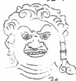
不動明王・三井寺