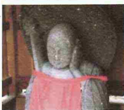
龍福寺の歯痛地藏菩薩

新潟市西蒲区の隠無し地藏（あごなしじぞう）については第一話で紹介しましたが、京都府城陽市の龍福寺には歯痛地藏菩薩様がおいでです。そもそも地藏菩薩は、お釈迦様の入滅後（なくなつたあと）、五十六億七千万年後に弥勒菩薩（みろくぼさつ）が出現するまでの間、現世に仏が不在となつてしまふ為、その間、六道すべての世界（地獄道・餓鬼道・畜生道・修羅道・人道・天道）に現れて人々の苦しみを救う菩薩であるとされていま