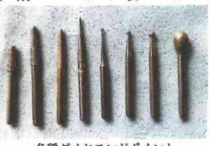
各種ダイヤモンドポイント

そのために現在では主としてダイヤモンドで削ります。 ダイヤモンドと比べても、細かいダイヤモンドの粉を焼き付けたものでダイヤモンドポイントと比べています。 ダイヤモンドポイントや用途により形態、サイズ、ダイヤモンドの荒さなど千差万別ですが、直径0.5mmから1.5mm程度のものがほとんどで大変小さいものです。このポイントを超高速の回転器具の先端に取り付け、歯にこすりつけて削ります。歯医者さんではピンという高い音がして歯を削っています。この音を聞いただけで逃げ出したくなる方もたくさんいらっしゃいます。これはエアーターピンの音です。エアーターピ