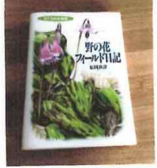
著者 松岡 真澄 発行 山と溪谷社 絶版。

絶版になっても、また、発行から23年も時が過ぎたことに驚いた。 本好きの夫の影響もあり、小さなお書店並みの書物が揃う。分類で棚に並ぶの、大概のことは調べる。 図書館で見つけ、手元に置きたいと思うと、買わないので増え続けた。 今は買わないように、と心がけるが、本屋には寄る。 ネット上で簡単に調べられるが、それは購入当時の価格は1800円。今、いくらか、と調べて絶版と知った。 ネット購入なら中古で数百円。もっとも、愛着がある。手放せない。