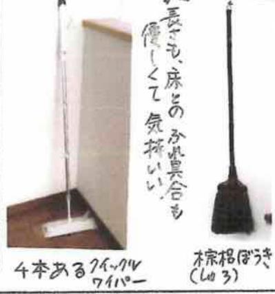
4本あるワイパー 棕櫚(320)