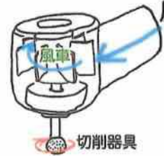
切削器具 エアーターピン模式図

ンというのは圧搾空気を小さな風車に吹きつけて切削器具を回す道具です。最近開発された機械で、私が学生時代(四十年ほど以前)クラス(八十人)に数台しかなく予約をとるのが大変でした。回転数は一分間に三十万回転で、このスピードは宇宙ロケットの燃料ポンプの回転数に匹敵し、他に類を見ない早さです。削る時の摩擦熱がすごい、水をかけながら削ります。ダイヤモンドはこの世で一番硬い物質ですから何でも削れます。しかし、硬すぎて削っているものの硬さがよくわかりません。象牙質や虫歯の硬さを感じながら削る時は電気エンジンに鋼で作ったスチールバーを付け比較的低速で削ります。電気エンジンは百五十年程度の歴史があります。現在では手元にマイクロモーターを仕込んだハンドピースを使う軽快なものになっていきます。一般に回転数は一分間に数千から二万回転程度ですがギヤーを介して十万回転以上もできるもの(増速コントラ)や数十回転のもの(超低速コントラ)まで用途に応じていろいろあります。