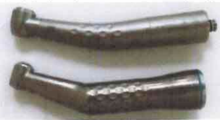
上:エアーターピンハンドピース 下:電気エンジンハンドピース

歯科治療が嫌われる最大の原因は歯を削る音とこの音から連想される痛みでしょう。この歯を削る音無くすためにレーザー切削や振動切削などいろいろな方法を現在考案中です。