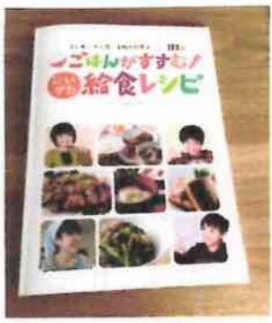
監修 新潟県学校栄養士協議会 発行 新潟日報 専業者 定価 1200円+税

絶版になっても、また、発行から23年も時が過ぎたことに驚いた。 本好きの夫の影響もあり、小さなお書店並みの書物が揃う。分類で棚に並ぶの、大概のことは調べる。 図書館で見つけ、手元に置きたいと思うと、買わないので増え続けた。 今は買わないように、と心がけるが、本屋には寄る。 ネット上で簡単に調べられるが、それは購入当時の価格は1800円。今、いくらか、と調べて絶版と知った。 ネット購入なら中古で数百円。もっとも、愛着がある。手放せない。