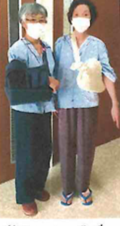
後見とキャンティ枕

コソコソ相み様々なことを、ぼそぼそいって。個室とはいえ、コロナ禍での入院生活はストレスが溜まる。 幸い隣室の方が上越在住で、ご主人と夫が高校の同級生(主治医も後輩!)とわかり、時折話をかけて下さるようになった。互いの状況報告で辛さは和らぎ、先生の毎朝の回診で励まされ、職員たちの笑顔に助けられた。 私の断裂は転倒だったか、隣室の女性性、車の助手席から後部座席の荷物を取ろうと無理な姿勢をした途端、右肩も断裂したようだ。当然入院棟には同様の手術の人が多い。断裂も二回目、三日目の人も抜糸人。利き手肩痛だ。 と、と利き手が出てしまっから、と主治医が指さしていたが、患者を責めず、まさか、そんなことかと思つてばかりだった。 退院して十日余り。まだ簡単な家事だけで、診療室には顔を出さないようにしている。 自主訓練とリハビリ通院が続く。軽いと思つても植木鉢など持つのは2kg以上の重さに用心をとり、リハビリ時、何度も言われた。 まだ痛みは消えない。先ずは三か月油断せずに生活しなければ。半年たてばある程度の生活は可能に。三年後完治、という。 今でも、たぶん手術は体験したか、心に辛かったのは初めて。 それでも、毎日夫からの自宅庭の花便りや、息子たち家族からのメールにいやされぬ。 長期不在は、家族も大変だった。だろうし、多くの皆に苦勞をかけた。感謝。又頑張ります。