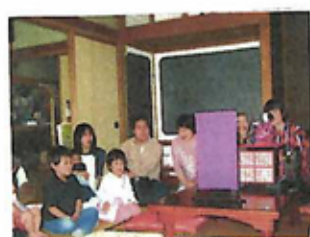
18年前 読者のみなさんと楽しんだ。