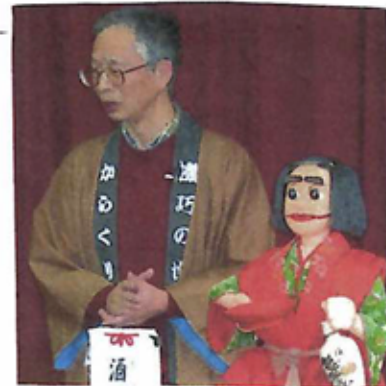
日根之和さんと 酒呑童子