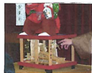
仕掛けを説明、細かい作りに関心、からくり、すごい。

陽気な宝クジのコマーシャルを見る度に 一筆〇億円なんて、どうせ当たらぬ、のだから、百万円の当選者をドックと増やしたらどうよ、とTV画面に何かつてボヤク。高懸当選など、夢の又夢。 ずいぶん前だが、スタッフに「百万円当たった、どうする？」と聞くと、買物が旅行に行く、と答えた。何もかも値上がりは今、生活費にまわす、と答えるかもしれない。 闇バイトで百万円、と、恐ろしい世の中。危事も加えて得て、平穩でいられるはずもない。 揃うぬ狸の夜算用、小さな夢をみるもの、宝クジは買わない。買わなければ決して当たらぬものに。ショップ、センター、横の宝クジ売場を素通りして、いちごを買って帰った。 今年の年賀状、切手シールの二枚当たった。