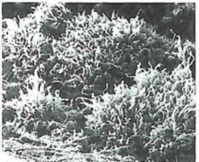
歯の表面に付着した細菌の塊 リーテ う蝕予防と保存治療

くつつく性質があります。この塊のことをプラークといい、極めて酸性が強く、歯の中からカルシウムを溶かしていきます。これを脱灰といいます。脱灰が起きると歯の表面が崩れて穴が開きます。この穴の中にプラークが入ると簡単に除去できませんので虫歯はどんどん広がってゆき、さらに歯を構成するタンパク質を分解する細菌も活躍するようになります。 と言うことで、虫歯の発生には砂糖がととも影響があり、特に飲み物(ジュース、コーラ等)が虫歯の大きな原因です。注意して飲みすぎないように。また、ミュータンスは親から子へと伝染します。食器を口渡しで子供に与えたり、食器を共用することは避けましょう。