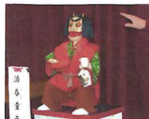
酒呑童子 お酒を飲み残したあとの顔は鬼面になり、2枚の男の子が大泣きました。