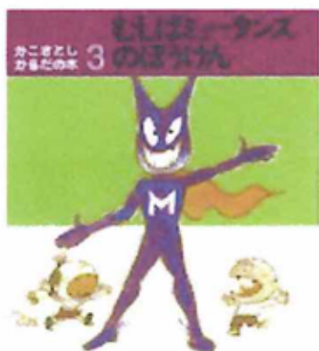
むし歯菌のぼうけん かこ さとし

くつつく性質があります。この塊のことをプラークといい、極めて酸性が強く、歯の中からカルシウムを溶かしていきます。これを脱灰といいます。脱灰が起きると歯の表面が崩れて穴が開きます。この穴の中にプラークが入ると簡単に除去できませんので虫歯はどんどん広がってゆき、さらに歯を構成するタンパク質を分解する細菌も活躍するようになります。 と言うことで、虫歯の発生には砂糖がととも影響があり、特に飲み物(ジュース、コーラ等)が虫歯の大きな原因です。注意して飲みすぎないように。また、ミュータンスは親から子へと伝染します。食器を口渡しで子供に与えたり、食器を共用することは避けましょう。