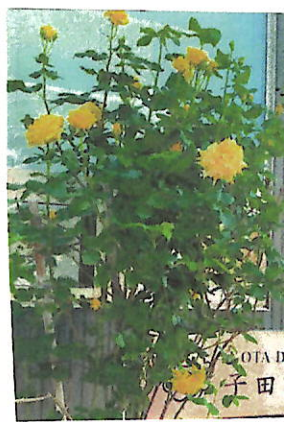
大輪の黄のバラ 符合窓窓から 眺められる。