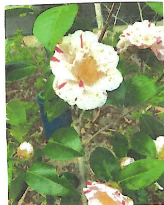
「プリンセス 雅子」 花は終末の、又 春の楽しみの花。

自宅や診療所の庭を折々に彩る。庭の小山からキンバ トの「ボッシュボッシュ」の音が響いてきた。風除けの木を探し に出かけた花樹園でひとときわ美しい椿をみつけた。 「プリンセス 雅子」。まあ素敵!と即購入。診療所の 庭には雅子様のお印りのハマナスも育てている。