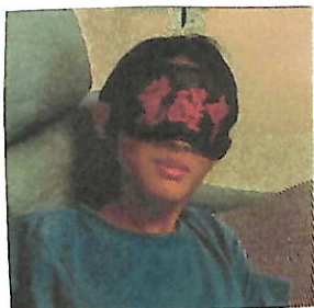
東北地方へ修学旅行 「覚醒中」のアイマスク。 楽しい思い出、又ハハッ。

ポストの数も減った けれど、「お茶の時間」 は、ポチポチながら 続けます。ご愛読を。